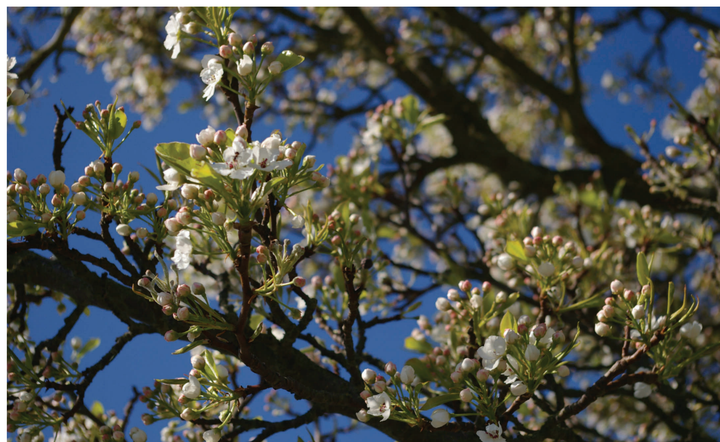
Wie schön ist es, während einer Wanderung, eines Spaziergangs oder einer Radtour erfrischende Früchte am Wegesrand zu finden. Die Baumblüte bezaubert im Frühling. Im Sommer und Herbst leuchten die Früchte und bei Nebel, Eis und Schnee zeigen sich die Bäume als bizarre Landschaftselemente. Besondere Bedeutung haben Obstbaumalleen als Standorte für alte Obstbaumsorten. Sie werden damit zum lebenden Hüter von bedrohtem Kulturerbe. Die Höhlen der alten, knorrigen Obstbäume sind Lebensraum vieler Tierarten.