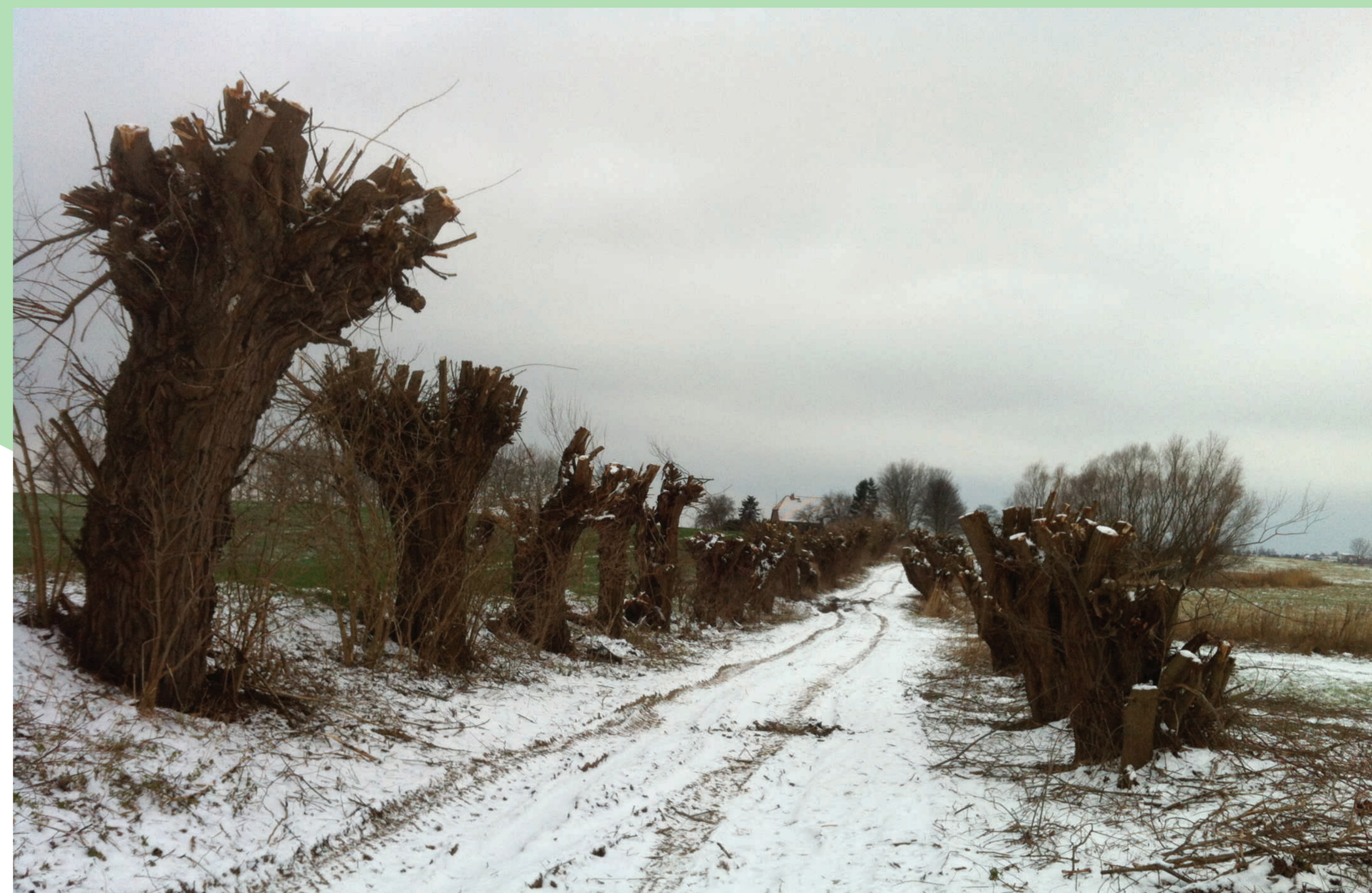
Alleen waren damals wichtige Holzlieferanten, Zweige wurden für die Korbflechterei genutzt, Blätter dienten als Einstreu und Nahrung für die Tiere und die Früchte waren eine willkommene Abwechslung auf dem Speiseplan. Aus diesen Gründen wurden viele Alleen mit schnell wachsenden Gehölzen wie Weiden, Pappeln und Ulmen angepflanzt.

Es wird angenommen, dass die ersten Alleen in Mecklenburg Ende des 12. Jahrhunderts gepflanzt wurden, als dieses Gebiet nahezu entwaldet wurde. Heinrich der Löwe hatte die slawische Macht vernichtet und deutsche Bauern kamen in dieses Gebiet. Bald hatte sich ein dichtes Netz von Dörfern gebildet und Wälder wurden gerodet. Um den Holz- und Obstbedarf zu decken, wurden an Wegen Weiden, Obstbäume, Pappeln, Ulmen und auch Walnussbäume gepflanzt.