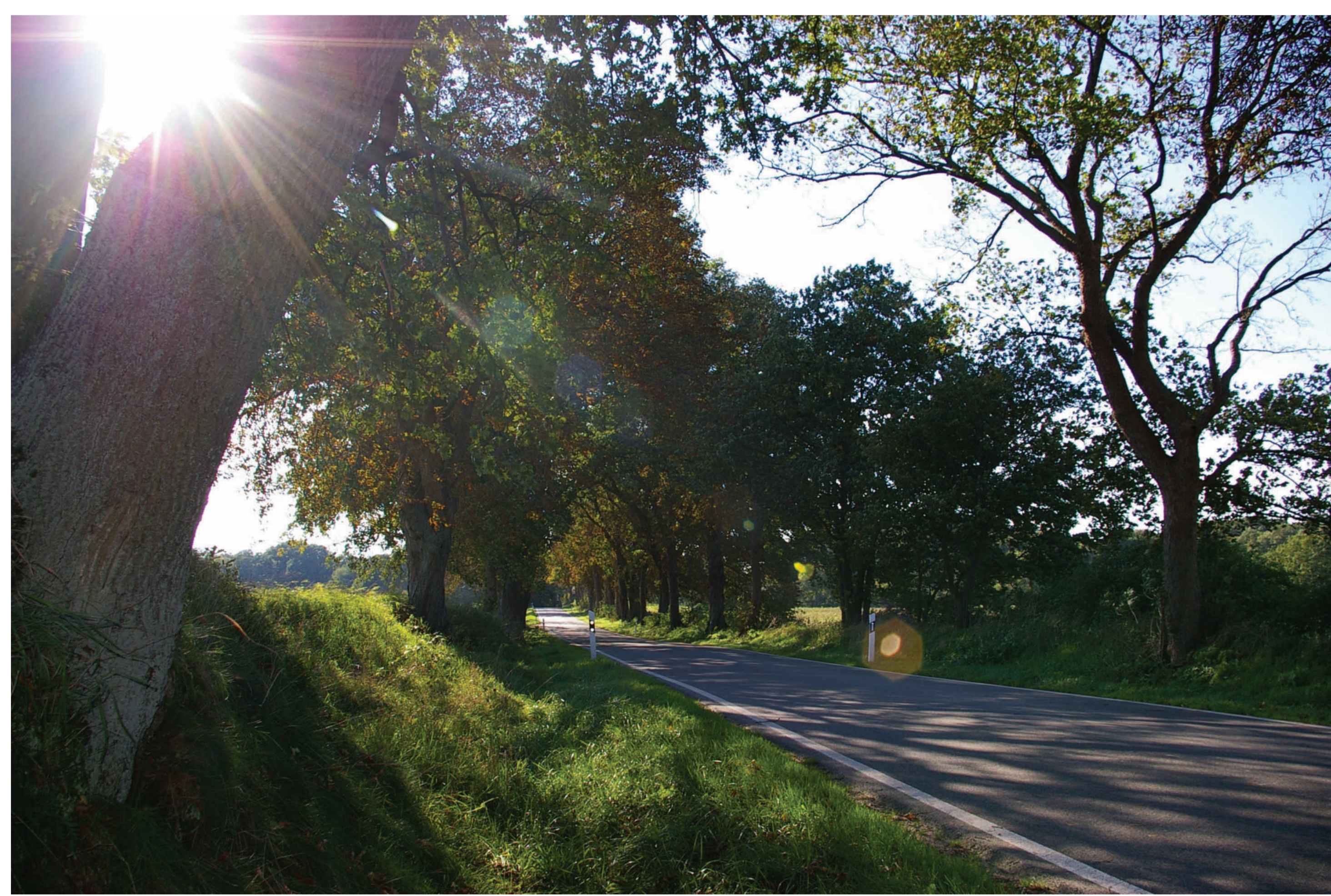
Der praktische Nutzen von Straßenbäumen wurde erkannt, nämlich die Befestigung von Wegen und Böschungen, der Schutz vor Sonne, Wind und Regen und nicht zuletzt die Alleen als Wegweiser in Dunkelheit, bei Nebel und Schneetreiben.

In den barocken Gartenanlagen im 17. und 18. Jahrhundert wurden vor allem die Sommer-Linde oder die Holländische Linde gepflanzt. Ulmen und Hainbuchen lösten später die Linden als Modebaum für Alleen ab. Diese Bäume zeichnen sich durch ihre gute Schnittverträglichkeit aus. Eichen, Buchen, Rosskastanien, Esskastanien, Pappeln und Robinien wurden dagegen in dieser Zeit als Alleebaum kaum verwendet, da sie geschnitten „unansehnlich“ aussehen. Erst später ab dem 19. Jahrhundert, als die Alleen aus den Städten hinaus in die freie Landschaft führten, also außerhalb von Gärten und Schlossanlagen, wurden auch diese Baumarten wieder gepflanzt.